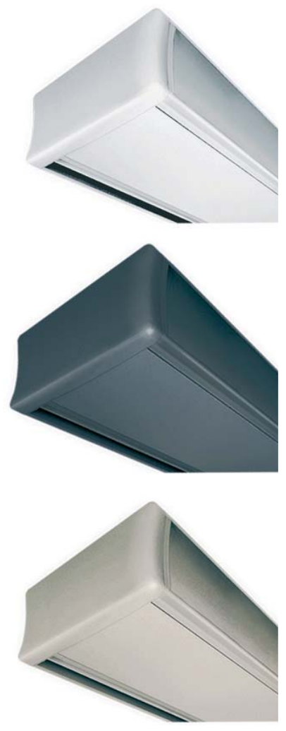
Различное цветовое исполнение